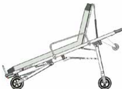
Position béquille arrière repliée