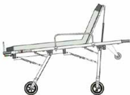
Position intermédiaire 1