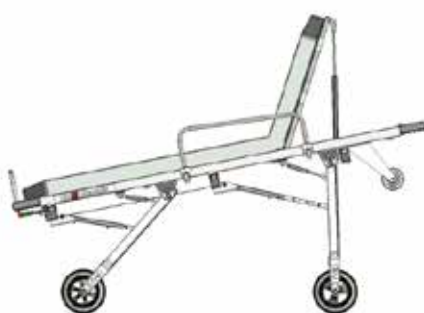
Position intermédiaire 2