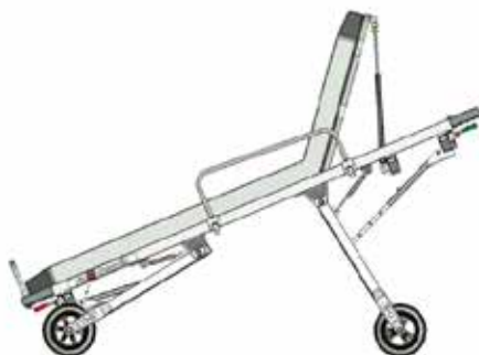
Position béquille arrière repliée