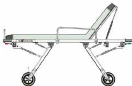
Position intermédiaire 1 Ht : 680 mm