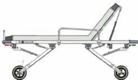
Position intermédiaire 2 Ht : 550 mm