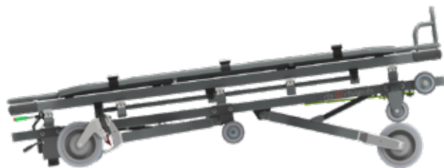
Position intermédiaire 2 (basse)