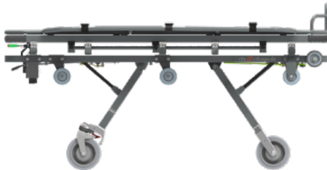
Position intermédiaire 1 (haute)