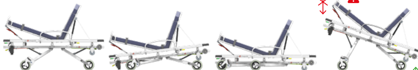
Position intermédiaire 3 Ht : 545 mm