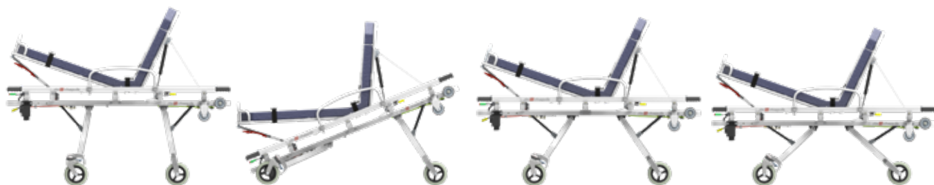
Position roulage / brancardage